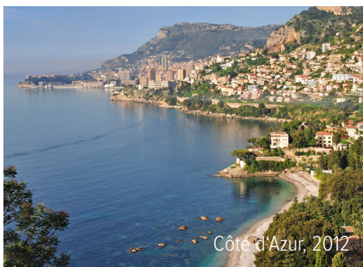
Côte d'Azur, 2012